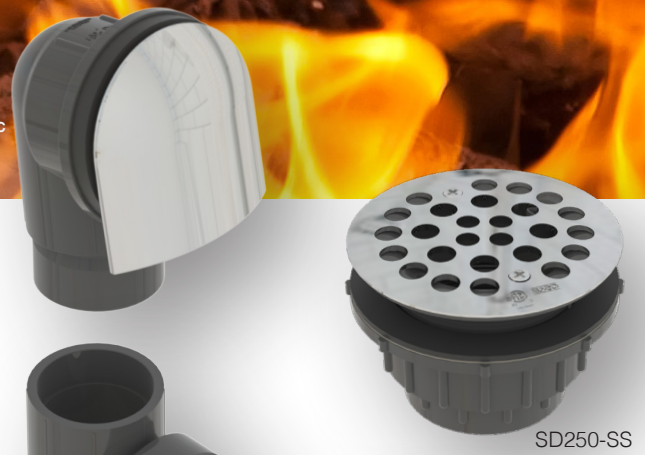
Modèle présenté 2550QK-CP

* La mention « cCSAus Meets UPC » signifie que le produit est conforme aux exigences des codes CNP, CUP, IPC et IRC.