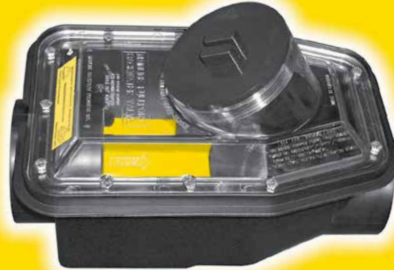
For Valve Dimensions see right side panel Pour Dimensions du Clapet voir le panneau de côté droit